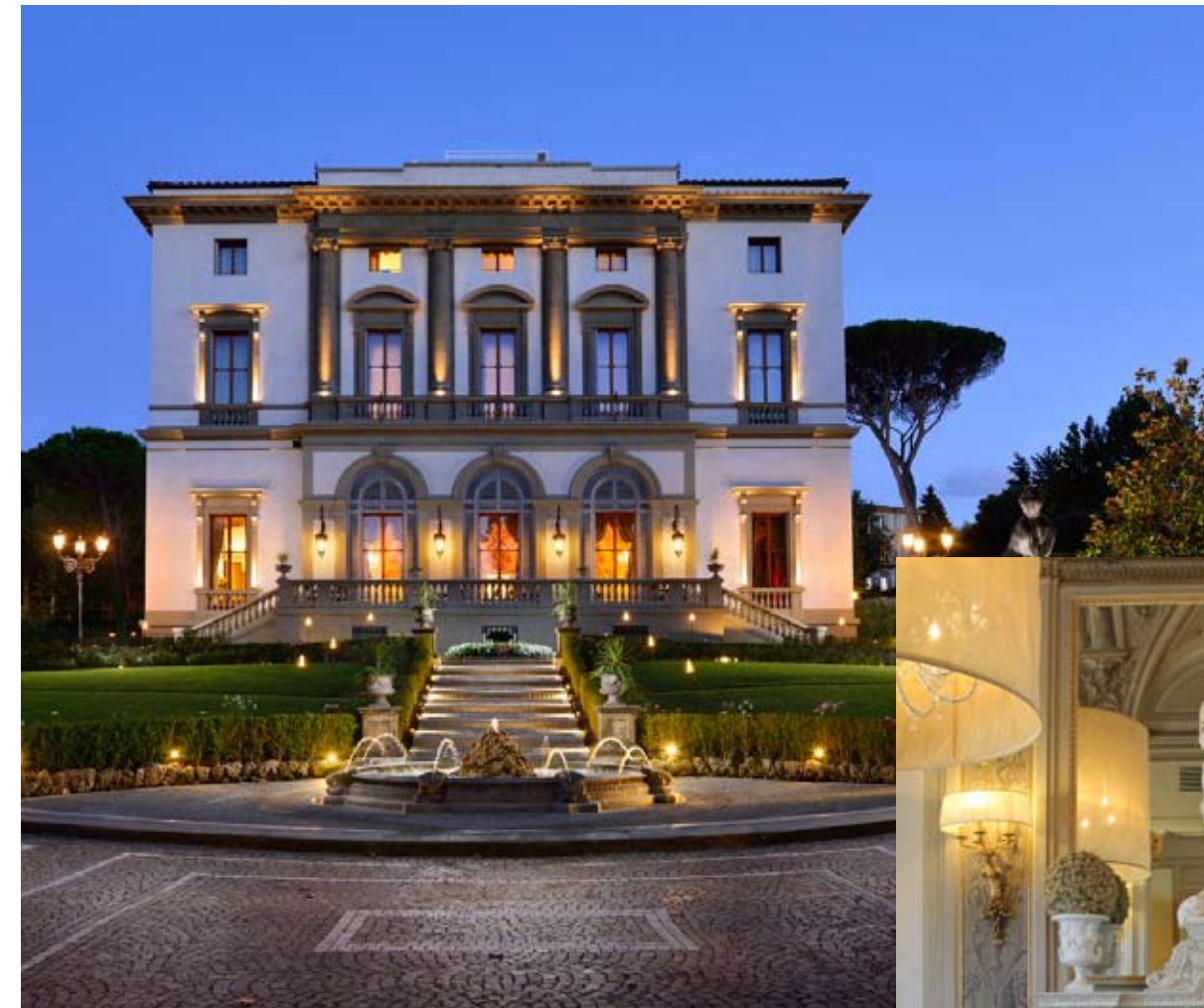
VILLA CORA (FLORENCIA, ITALIA)

Todo el encanto y la exquisitez de Florencia están reunidos en el Hotel Villa Cora. Se trata de una preciosa residencia aristocrática del siglo XIX rodeada de un paisaje bucólico. Por sus salones, habitaciones y jardines se han paseado personajes históricos como la emperatriz Eugenia, esposa de Napoleón III, el músico francés Claude Debussy y el emperador japonés Akihito.